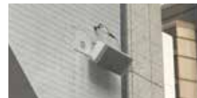
アンプ/スピーカー1セット BOSE製DS40SE