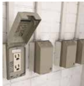
電源:コンセント2口 (100V/20A)× 3カ所