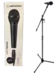
マイク/スタンド 1,000円