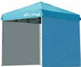
飲食ブース3セット 2,000円/1セット