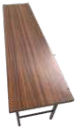
450×1,800、450×1,500 長テーブル2脚ずつ