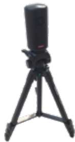
プロジェクター 5,000円