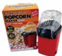
ポップコーンマシン1台 500円