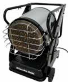
ジェット型ストーブ