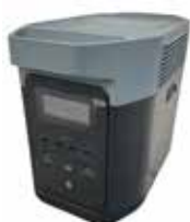
ポータブル電源1台 定格1500W 5,000円