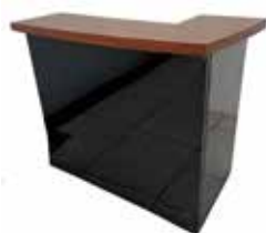
バーカウンター1台