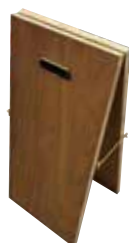
A型看板4台 (掲示サイズ:A3縦)