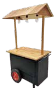
移動式屋台1台 (900 × 650mm) 5,000円/1台