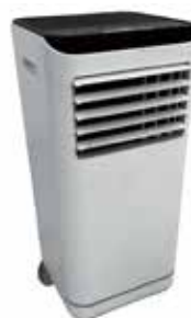
スポットクーラー1台 2,000円

・看板用のチラシやメニュー表などの印刷について、三宮プラッツでも印刷可能です。 カラープリント50円、白黒プリント10円 (最大A3、両面印刷不可、当日対応可)