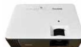
高機能 プロジェクター1台 10,000円