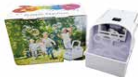
バブルマシン1台 (シャボン玉液別) 500円