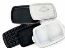
ホットプレート1セット (鍋・グリル・たこ焼き) 1,000円