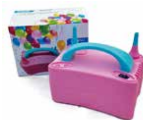
電動エアポンプ1台 風船用 500円