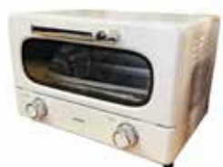
オーブントースター1台 500円