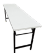
長テーブル6脚 (450 × 1800mm) 500円/1脚