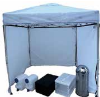
飲食ブース4セット 3,000円/1セット