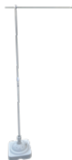
のぼり用 台座付ポール6台 500円/1台