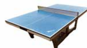
卓球台 (ラケット、ピン球あり)