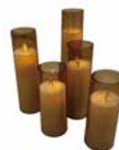
LEDキャンドル25本 100円/1本