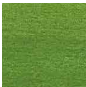
人工芝(10 × 6m)1式 3,000円