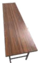
450×1,800、450×1,500 長テーブル3脚ずつ