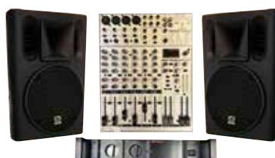
スピーカー・アンプ・ミキサー1式 10,000円