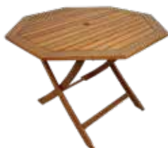
カフェテーブル5脚