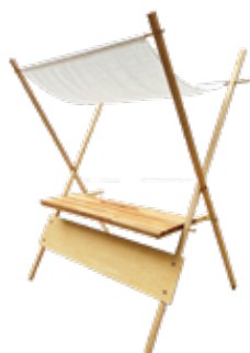
マルシェスタンド4台 (1,500 × 450mm) 3,000円/1台