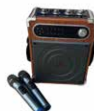
ポータブルマイク1台 1,000円