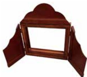
紙芝居舞台1台 (サイズ:24.7×34.6cm) 500円