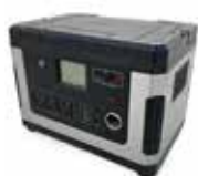
ポータブル電源1台 定格300W 3,000円