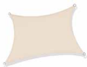
日除けタープ1式 2,000円