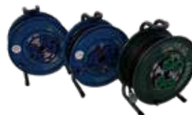
ドラムリール (20m2台、30m1台)