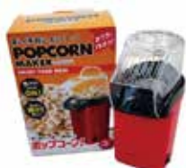
ポップコーンマシン1台 500円